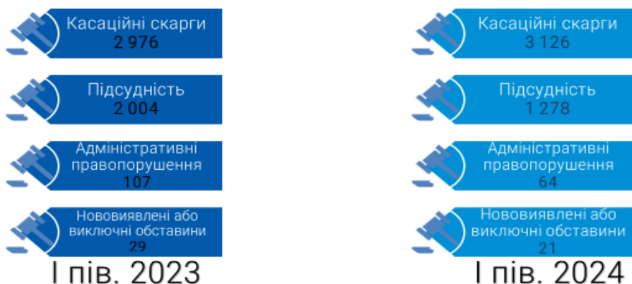
Структура розглянутих ККС ВС процесуальних звернень і кримінальних проваджень

Із загальної кількості розглянутих у першому півріччі 2024 року процесуальних звернень майже кожне шосте процесуальне звернення повернуто або визнано таким, що не підлягає розгляду (з урахуванням вимог статті 383 Кримінально-процесуального кодексу України 1960 року), – 756 [774], або 16,8 % [15,1 %] від розглянутих.