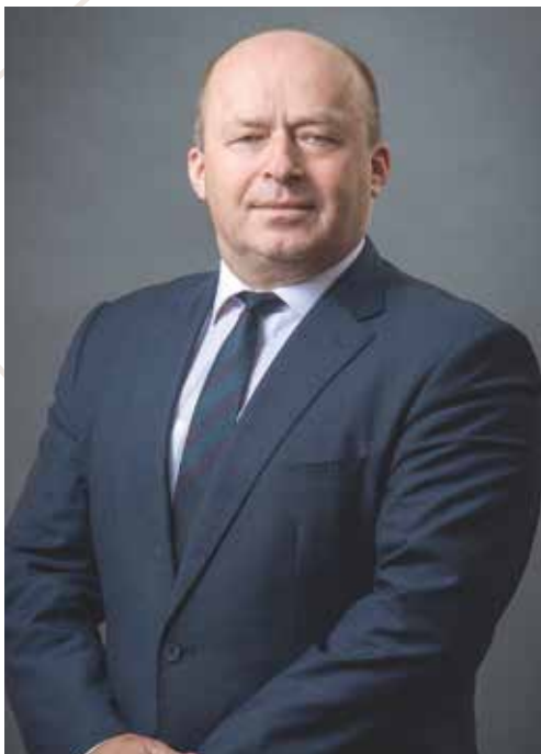
Михайло СМОКОВИЧ, голова Касаційного адміністративного суду у складі Верховного Суду

2022 рік є знаковим та ювілейним для адміністративної юстиції.