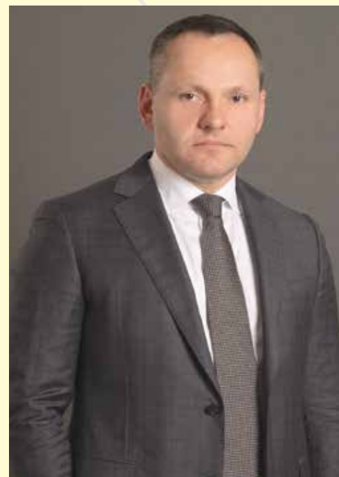
Андрій РИБАЧУК, секретар судової палати з розгляду справ щодо захисту соціальних прав