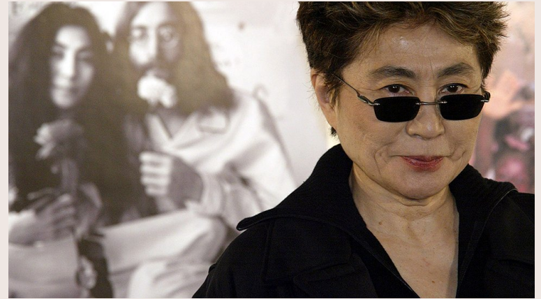
Йоко Оно (1933 р.н.)

«Посміхайся майбутньому і воно посміхнеться тобі у відповідь»