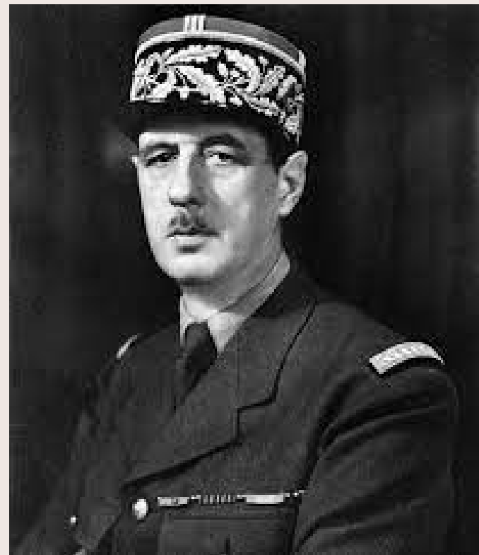
Шарль де Голль (1890-1970)

«Завжди обирайте самий складний шлях – на ньому Ви не зустрінете конкурентів»